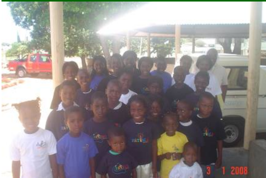
Meninos de Xai-Xai